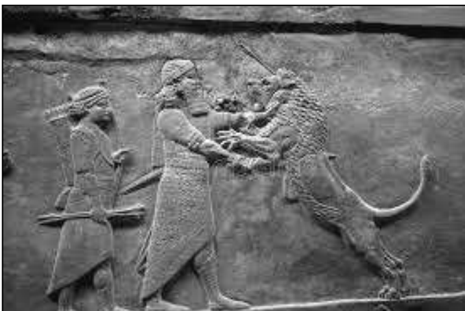
Bas-reliefs de la Chasse aux lions, palais d'Assurbanipal à Ninive, - IXe s., Londres, British Museum.